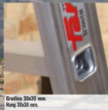
Gradino 30x30 mm. Rung 30x30 mm.

LE IMMAGINI SONO FORNITE AL SOLO SCOPO ILLUSTRATIVO E NON COSTITUISCONO ELEMENTO CONTRATTUALE. THE IMAGES ARE PROVIDED ONLY FOR ILLUSTRATIVE PURPOSES AND DO NOT CONSTITUTE A CONTRACTUAL ELEMENT