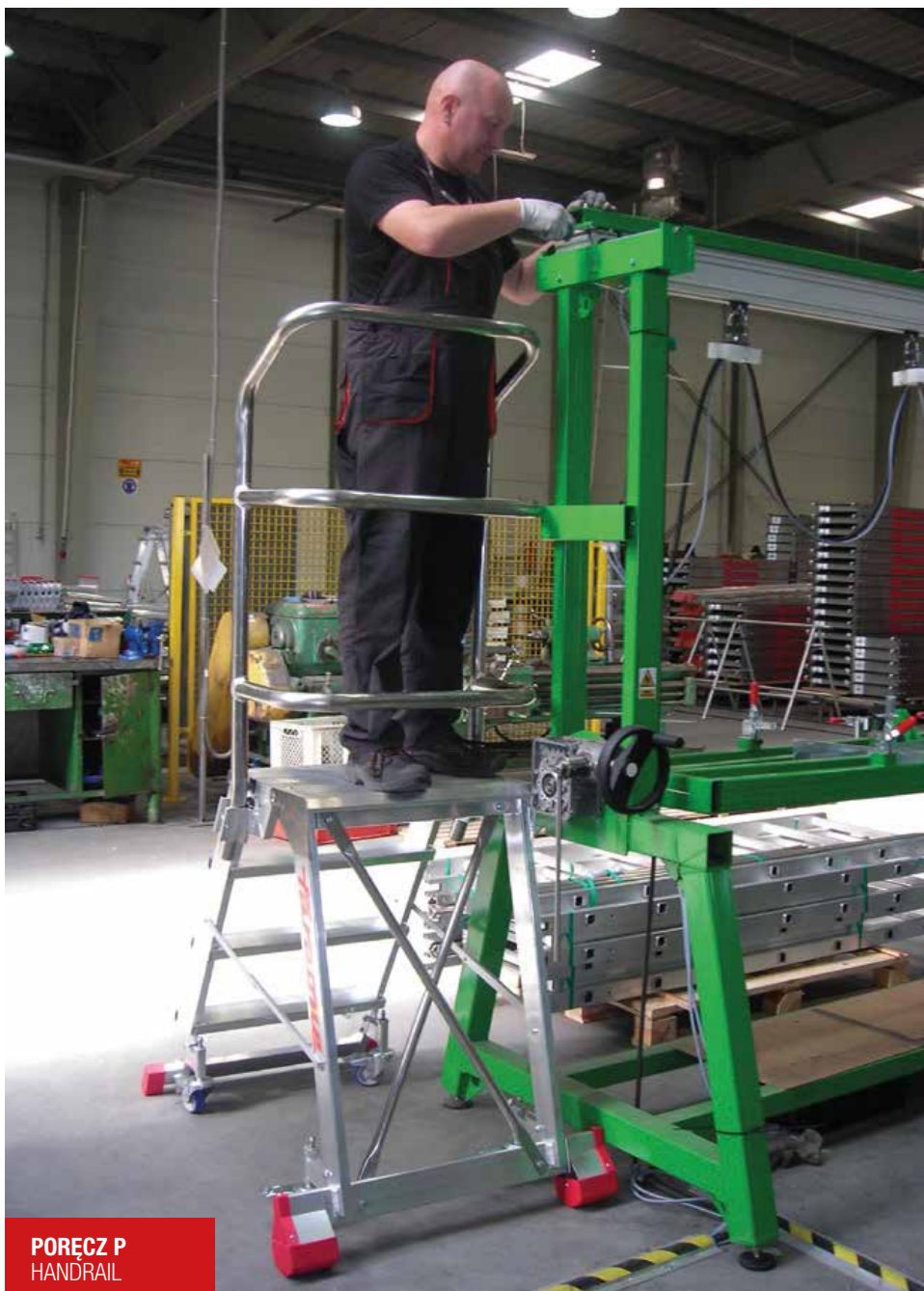
PORĘCZ P HANDRAIL

Mocne, proste w użyciu i bezpieczne, ze stopniami 15 cm i z profilem 10 cm. Wygodne wchodzenie przy nachyleniu 60°. Szeroki górny podest 57x31 cm lub 57x47 cm i szybki system składania.