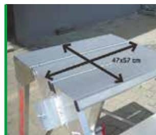
POWIĘKSZONY PODEST L